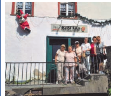
Sechs Mädels aus dem Tennisclub, die reisen furchtbar gerne. Deshalb zieht's diesen lustigen Trupp einmal jährlich in die Ferne. Und das seit 33 Jahren! Mal seh'n, wo sie demnächst hin fahren.