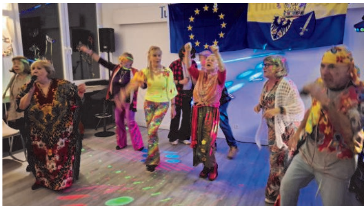
Auch 2025 war die Stimmung im Vereinsheim riesig.

Sie feiern halt auch gerne Karneval, die Männer und Frauen der Theatergruppe turbu-lent 03 und sie haben sich auch wieder Gäste eingeladen, um das kleine, aber feine Bühnenprogramm zu gestalten.