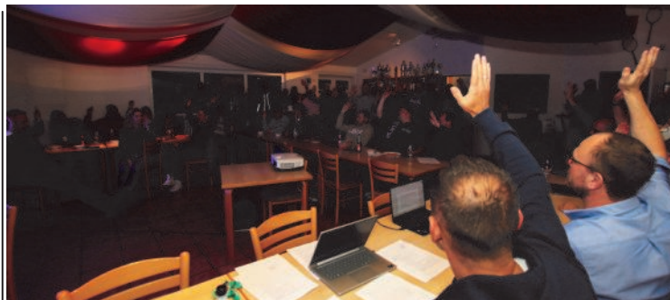
Einstimmiges Votum: Der TC Frintrop ist gegründet!

„Wir bedanken uns bei allen Beteiligten für das Vertrauen