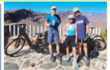
Mirador de Fataga mit 600 Höhenmetern, gar kein Problem mit Mountain E-Bikes mit Milch in den Schläuchen (für Pannen - kein Scherz). Wie würden die Räder wohl laufen, wenn man Bier da reinschüttet?? Wir haben hier 28 Grad und am Abend 23, einfach herrlich.