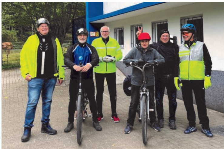
Morgens um 10 ging es am Vereinsheim los.