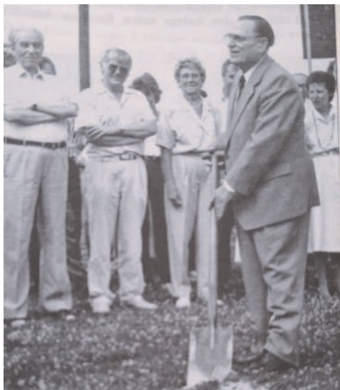
Erster Spatenstich am 8. Juli 1989