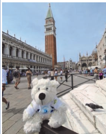
Frintrops weitgereistes Bärchen ist dieses Mal in Italien unterwegs und zeigt sich hier in Venedig vor dem Dogenpalast und St. Markus.

Macht es wie unser T-Bär-F-Maskottchen: Schickt uns Fotos mit euch oder Grüße aus eurem Urlaub. Einfach eine Karte an TBF Werkhausenstraße 16 45359 Essen oder noch besser eine Mail an urlaubsgruesse@tbfo3.de .