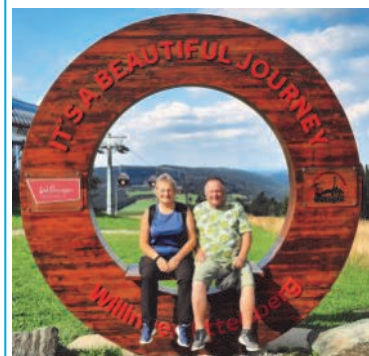
Und die Braunes hockten sich in Willingen fürs Foto nieder.