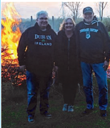
Strübbel, das Herz von Schleswig-Holstein. Moin, schöne Grüße an den TBF und natürlich an Euch vom Mai-feier aus Strübbel von den RIESEN