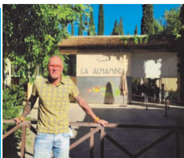
Buenos Dias von der Alhambra im spanischen Granada sendet Jörg Thiesling.