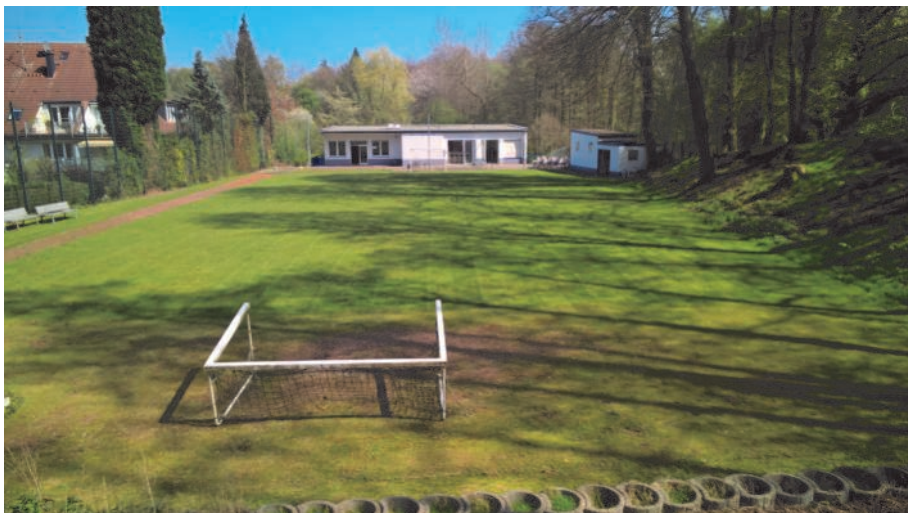
Unsere schmucke Vereinsanlage in der Werkhausenstraße ist inzwischen 70 Jahre im Besitz unseres Vereines.

Die Chronik schreibt im Jahr 1958, dass der Vereinsbetrieb etwas leidet. Zu sehr ist man vielleicht auf andere Dinge konzentriert wie den Ausbau der neuen Platzanlage. Ansonsten war das Jahr 1958 hauptsächlich damit ausgefüllt, die restlichen Arbeiten an der Platzanlage durchzuführen,