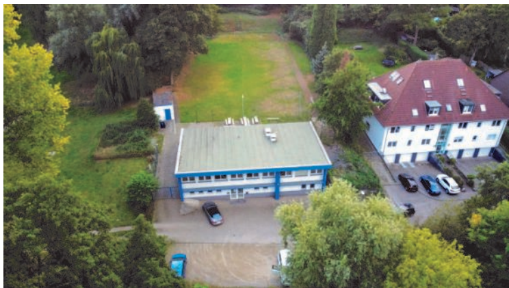
Südwestlicher Blick auf unsere Vereinsanlage

befand sich etwas weiter östlich), wurde ausgebaut und der Umkleideraum eingerichtet. Grundwasserschwierigkeiten, wie sie auch später noch auftauchten, ließen sich durch eine Dränage beheben. Eine steinerne Treppe, die auch heute noch vorhanden ist, führte vom Hauptplatz hinauf auf einen an der Westseite der Anlage gelegenen Erdsockel, wo die Reck- und Ringgerüste untergebracht waren.