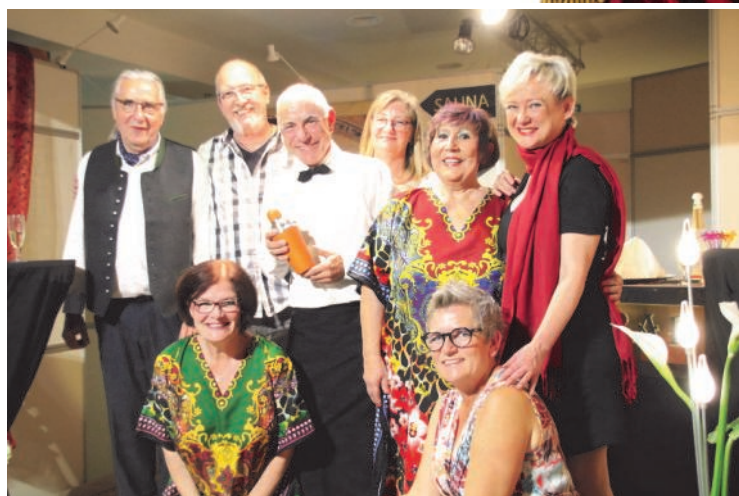
Ensemble TurBu-lent 03