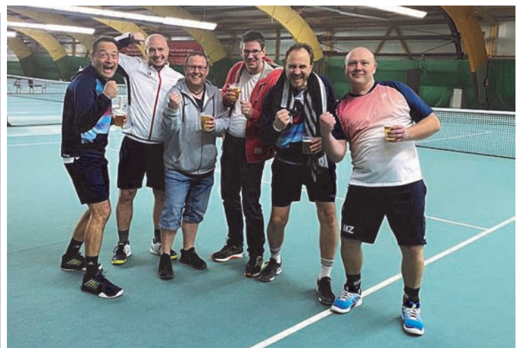
So sehen Sieger aus!

Am 27. März kam es in der Winterhallenrunde zum Spitzenspiel bei den Herren 40, Bezirksklasse A, Gruppe 14. Im Verlaufe dieser Winterhallenrunde konnte die erste Mannschaft der Herren 40 zwei Siege und ein Unentschieden einfahren. Am letzten Spieltag war das Spiel gegen ETUF 2 angesetzt. Die Spieler vom ETUF kamen auf zwei Siege, eine Niederlage und komplettierten somit das Spitzenspiel. Die Aufstellung der Gäste ließ keinen Zweifel daran aufkommen, dass der Aufstieg mit in den Essener Süden genommen werden sollte. Mit zwei Spielern der LK 8 und zwei Spielern der LK 15 wartete auf die Jungs vom TBF eine harte Aufgabe. Während die vermeintlich "leichteren" Gegner in den Begegnungen 3 und 4 warteten, kam es bei den Spielen 1 und 2 eigentlich zu kaum lösbarer Aufgaben. Während sich der Spielführer vom TBF gegen einen ehemaligen ATP-Spieler mehr als beachtlich geschlagen hatte, kam es im Spiel 1 zu der erhofften, aber kaum für möglich gehaltenen Sensation. In diesem Spiel wurde der entscheidende