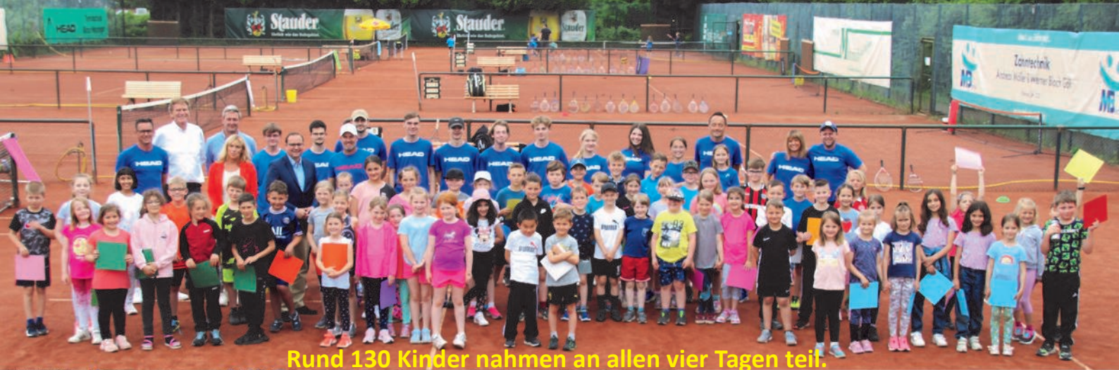
Rund 130 Kinder nahmen an allen vier Tagen teil.