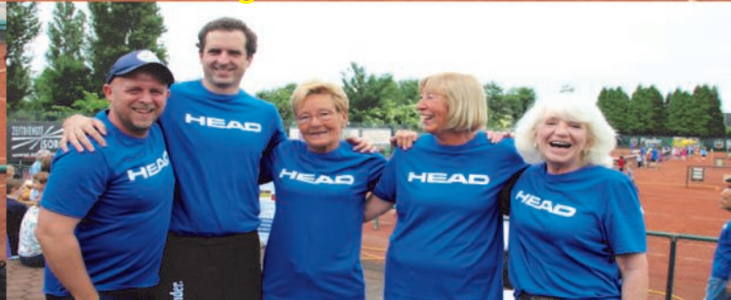
Neben den vielen Kindern waren die vielen Helfer an diesen Tagen auch ganz besonders wichtig. Ganz herzlichen Dank an alle Helfer!